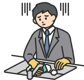
過小な要求 ( 能力や経験とかけ離れた仕事や 必要のない仕事を与える )