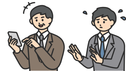
個の侵害 ( 私的なことへの過度な介入 )