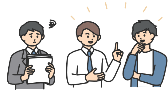
人間関係の切り離し ( 隔離・仲間外し・無視 )