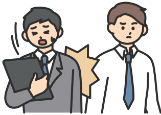
身体的な攻撃 ( 暴行等 )