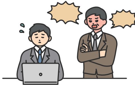
精神的な攻撃 ( 脅迫・名誉棄損・侮辱・暴言 )